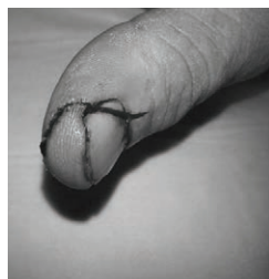
ブレードストップのみ：切り傷